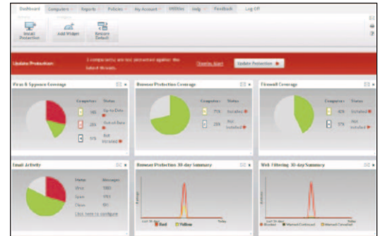
圖 2：McAfee SecurityCenter 提供集中式的安裝、報告及原則設定管理。

從 Web 型的 McAfee SecurityCenter 主控台集中管理安裝、Microsoft Active Directory 同步處理、設定、報告、更新及群組管理等作業。只要利用 Web 瀏覽器存取受保護的 McAfee SecurityCenter 即可自訂報表工具、排程報告與升級或執行病毒與間諜軟體掃描。